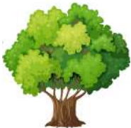
egen springer ud