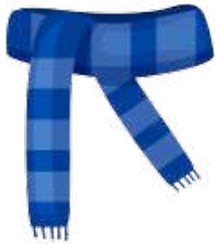
h a l s t ø r k l æ d e

Del ordet i 2 eller 3. Skriv ordene på linjen.