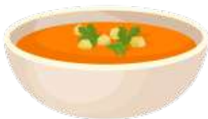
g r æ s k a r s u p p e