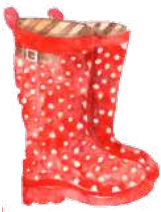
g u m m i s t ø v l e r