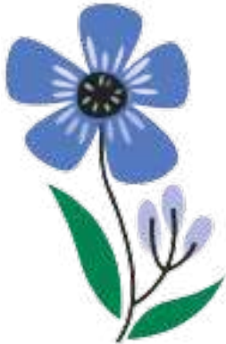
en smuk blomst