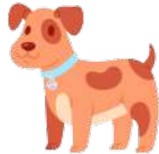
en sød hund