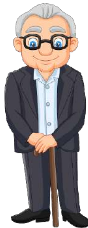
en gammel mand