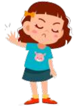
en sur pige