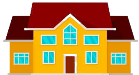
et stort hus