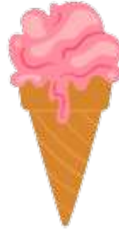
en kold is