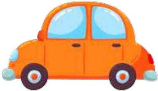
en orange bil