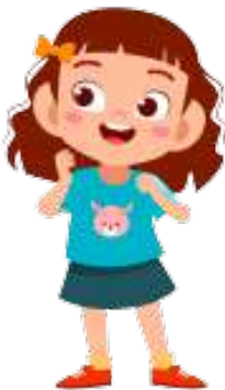
en glad dreng